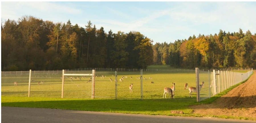
Blick auf die neue Weide

Damit unsere Damhirschherde wachsen kann, haben wir unser Gehege im vergangenen Herbst um rund 2 ha erweitert. Mit der Inbetriebnahme der neuen Weide ist die Zufahrt zum Hof nun nur noch von Osten her möglich, da die Tiere den westlichen Bereich der Hofstrasse für den Zugang zur neuen Koppel beanspruchen.